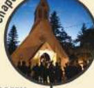
Chapelle du Rang 1