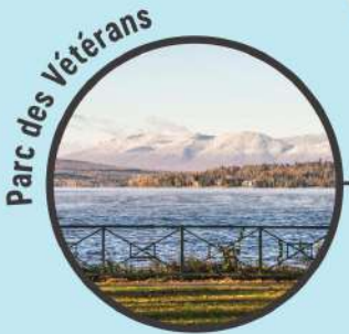
Parc des Vétérans