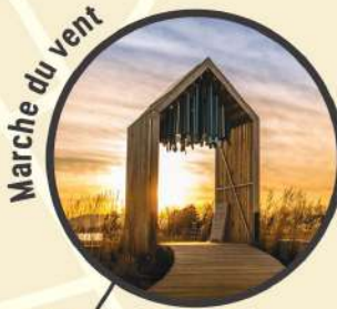
Marche du vent