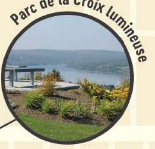
Parc de la Croix lumineuse