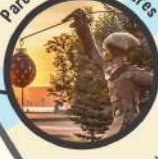
Parcours de sculptures